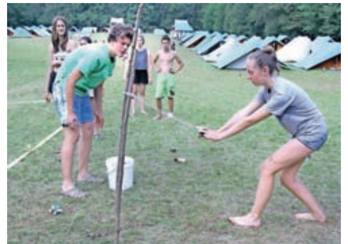
Pestro družabno življenje v taboru

ker sem želel podoživeti duh Kvajdeja izpred petih let. Zelo lepo je spoznati veliko novih prijateljev in biti odgovorno nor. Všeč mi je bilo, ko je 450 ljudi pelo himno in držalo roko v pozdrav. In po tem si bom zapolnil letošnji tabor, pa po zabavnem rimanju in blatu.«