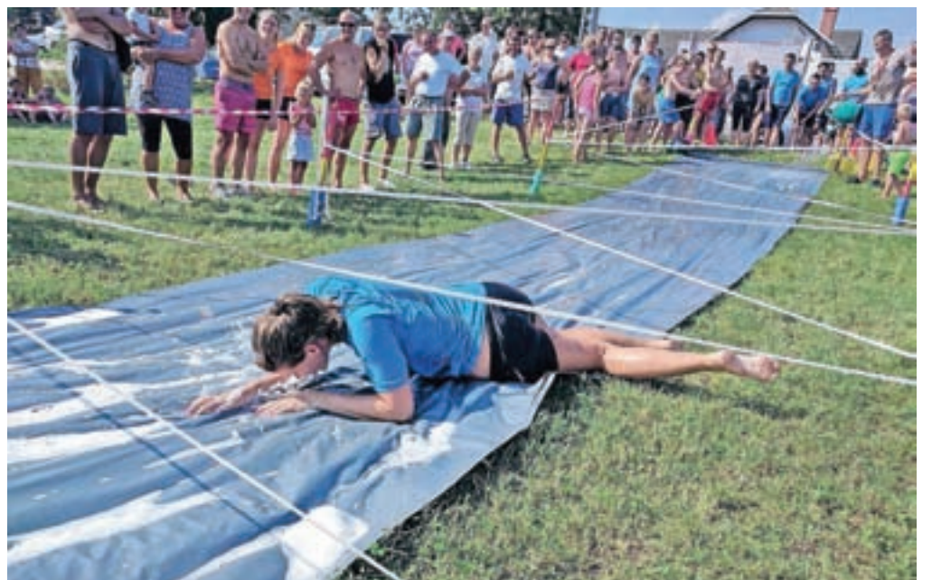
Zabavno, slikovito in naporno drsenje po mokri plastični podlagi pod cesto