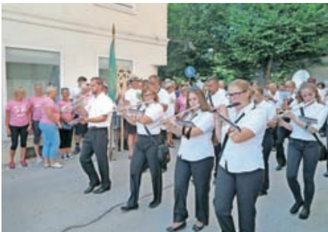
Ob vrnitvi pohodnikov v Radovljico je bil popoldan na Linhartovem trgu koncert treh pihalnih orkestrrov: domačega Pihalnega orkestra Lesce (na fotografiji), Godbe Gorje in Pihalnega orkestra iz Slovenj Gradca.