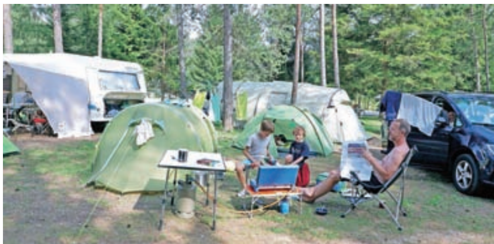
Letoňnja sezona je po številu nočitev najboljša v vsej zgodovini kampa.

ših. Tudi zato bodo finančni učinki prihodnjega poslovanja boljši. Višji standard pomeni višje cene, ki so po našem mnenju v tovrstni ponudbi Slovenije še prenizke,« je še dejal Zlatko Kavčič. Kot je dodal, so zadnja leta posvetili tudi pripravi dolgoročnih razvojnih načrtov, ne samo kampa Šobec, ampak celotnega rekreacijskega parka Šobec, ki obsega območje hipodroma in zadnje terase proti Savi Dolinki pod Lescami. »Gre za več kot petdeset hektarjev zemljišč, lastnik večine je Turistično društvo Lesce, ki je tudi edini lastnik kampa Šobec. Turistično društvo Lesce je prek svojega podjetja Hitur, d. o. o., tudi lastnik hipodroma Lesce. Tam je že dan v proceduro nov prostorski načrt, ki bo javno objavljen letos jeseni in predvidoma sprejet do konca leta. To bo omogočilo posodobitev hipodroma, katere obseg in časovnica bosta odvisna predvsem od sposobnosti tistih, ki bodo tam imeli konje. Končni cilj je sicer evropsko razpoznavni jahalni center, vendar le, če bodo za to pogoji in sposobni ljudje.«