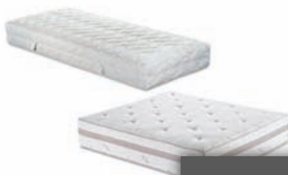
vzmetnice in postelje