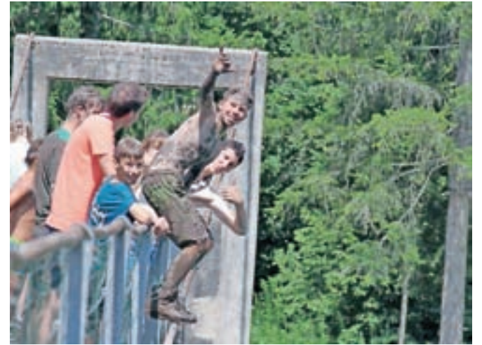
Skakali so s Fuksove brvi.