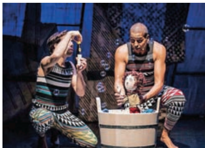
Iz predstave Juri Muri v Afriki

V letošnji abonmajski program Linhartove dvorane je vključenih šest predstav slovenskih profesionalnih gledališč. »Iz Mestnega gledališča ljubljanskega prihaja Družinski parlament, kjer bo priložnost videti vse slabosti vladanja na enem mestu. PG Kranj in SLG Celje sta združila vrhunske igralce v predstavi Žalujoča družina – gre za strupeno komedijo o lažeh, pohlepu in lovu na dediščino. Iz SLG Celje prihaja tudi predstava Meglica – ki govori o pomenu umetniških del, ki to morda sploh niso, iz SND Drama Ljubljana prihajata dve predstavi – Demokracija – politična satira o iluziji, imenovani demokracija, in Županova Micka, čisto sveža, čisto nova predstava, ki na ljubljanski oder prihaja septembra, na oder Linhartove dvorane pa upamo, da decembra, v mesecu, ko se je rodil avtor nepozabne komedije. V predstavi bo nastopila vrhunska igralska zasedba in ker pričakujemo velik naval, se dogovarjamo o dveh predstavah, tako da bodo na svoj račun lahko prišli tudi tisti, ki ne bodo imeli abonmaja. Kot zadnja v sezoni prihaja na oder operna diva brez poslu-