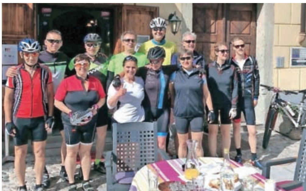
Na pot se kolesarji vedno odpravijo izpred kavarne Linhartov hram v starem mestnem jedru Radovljice.

»Iz Radovljice proti Beogradu smo se letos odpravili že tretjič. Tokrat smo posebno uživali v vožnji po slikoviti hribo-