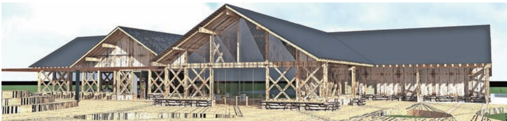
Novi objekt z restavracijo bodo zgradili na mestu sedanje trgovine. Glavni gradbeni material bo les, objekt bo zelo odprt, pritičen in zelo razgiban, z veliko teraso in prireditvenim prostorom. Ogrevan bo s toplotno črpalko, ki bo izkoriščala vodo iz bajerja, imel bo sončno elektrarno ...

Gradnja mora biti končana do konca marca prihodnjega leta. Po Kavčičevih besedah bodo investicijo, vredno blizu tri milijone evrov, v celoti financirali z lastnimi sredstvi. »Prostore trgovine nameravam oddati v najem, smo pred podpisom pisma o nameri z Mercatorjem, a to še ne pomeni, da ima možnost izključno to podjetje. Dokončna odločitev bo sprejeta po razpisu, na katerega se bodo lahko prijavi tudi drugi. Prav tako bomo oddali v najem tudi restavracijo. Prvi informativni razpis je zaključen. Zanimanje je. Končni razpis ali izbor bo sledil in bo bolj kot najemnini posvečen