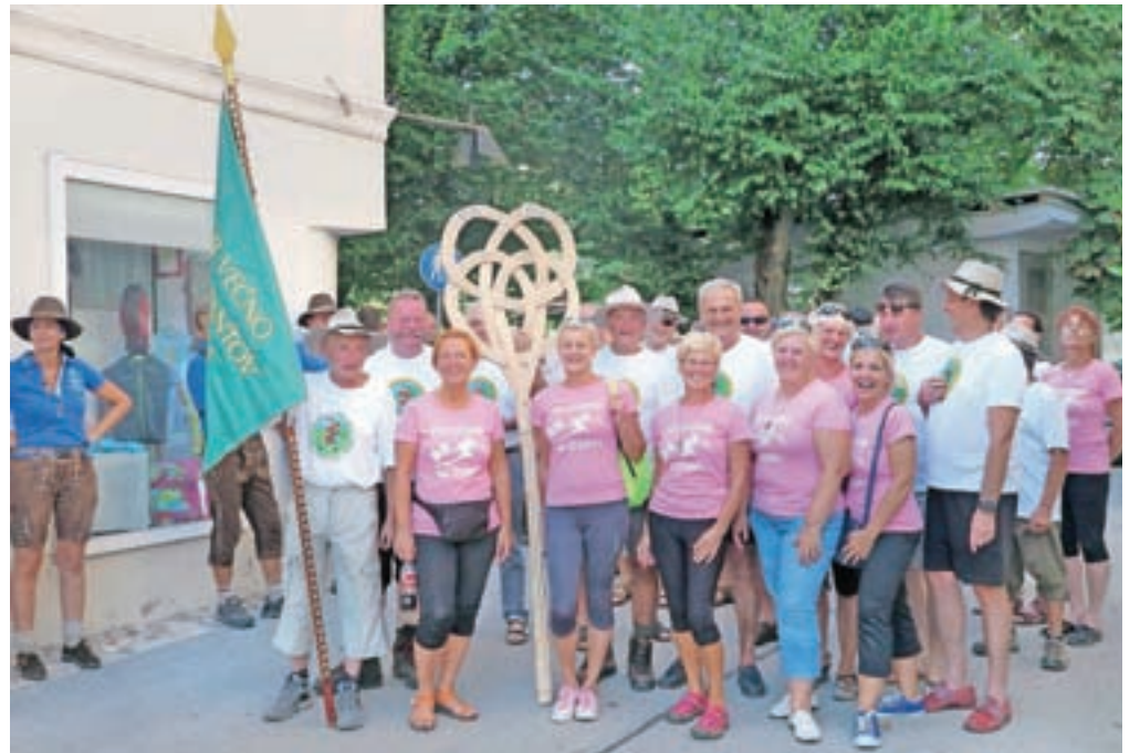
Pohodniki z letošnjim simbolom »klofarjem« so se po prihodu s Stola v povorki skupaj s pihalnimi orkestri odpravili proti Linhartovemu trgu.