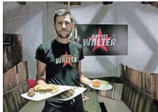
Edinstvena postrežba za vse ljubitelje bosanskih kulinarčnih dobrot: Walter vas bo vsak dan od 10. do 22. ure nahranil tudi v Radovljici.

hane, enolončnice, sudžukice, sarme, baklavo, tufahijo, tulumbe ... ter predvsem Walterjev zaščitni znak: čevapčiče v lepinji s čebulo in kajmakom ter domačo kavo s kokco ratluka. Vse to v Walterja upravičeno privablja vse gurmaske navdušence – enako velja tudi za simpatično gostilnico v Radovljici, ki se lahko pohvali tudi s prijetnim notranjim ambientom ter s prostorno zunanjo teraso. Vsa kulinarčna ponudba, ki jo popestri balkanska glasba, tako predstavlja pravi raj ne le za vse jugonostalgike, temveč vse, ki cenijo prave specialitete bosanske kuhinje.