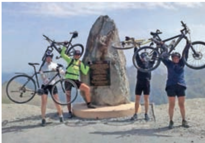
Navdušenje nad osvojenim prelazom v italijanskih Dolomitih.

viti Slavoniji med Savo in Dravo. Imeli smo tudi gorski cilj, 490 metrov vzpona v