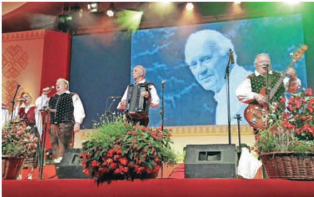
Alpski kvintet je v spomin na Vilka Ovsenika zaigral večnega Pastirčka.