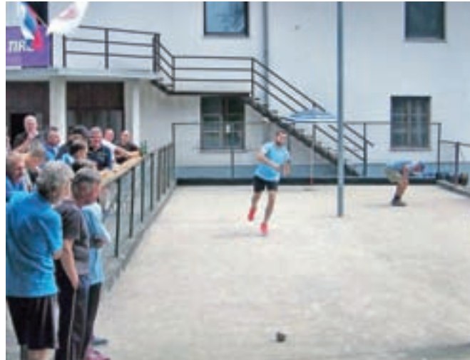
Veliko je bilo zbijanja.

Leta 1988 je bil prvi turnir na Posavcu. Sledila sta še dva, nato se je z izgradnjo