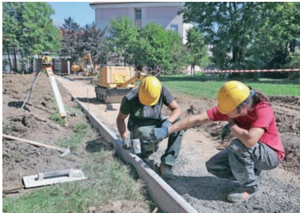
V zadnjih dneh šolskih počitnic so urejali tudi pešpot od avtobusne postaje mimo upravne enote do gostinske in turistične šole, ki jo uporabljajo predvsem srednješolci.

Radovljiške vrtce – v ustanovo je organiziranih sedem enot – bo od 1. septembra lahko obiskovalo največ 757