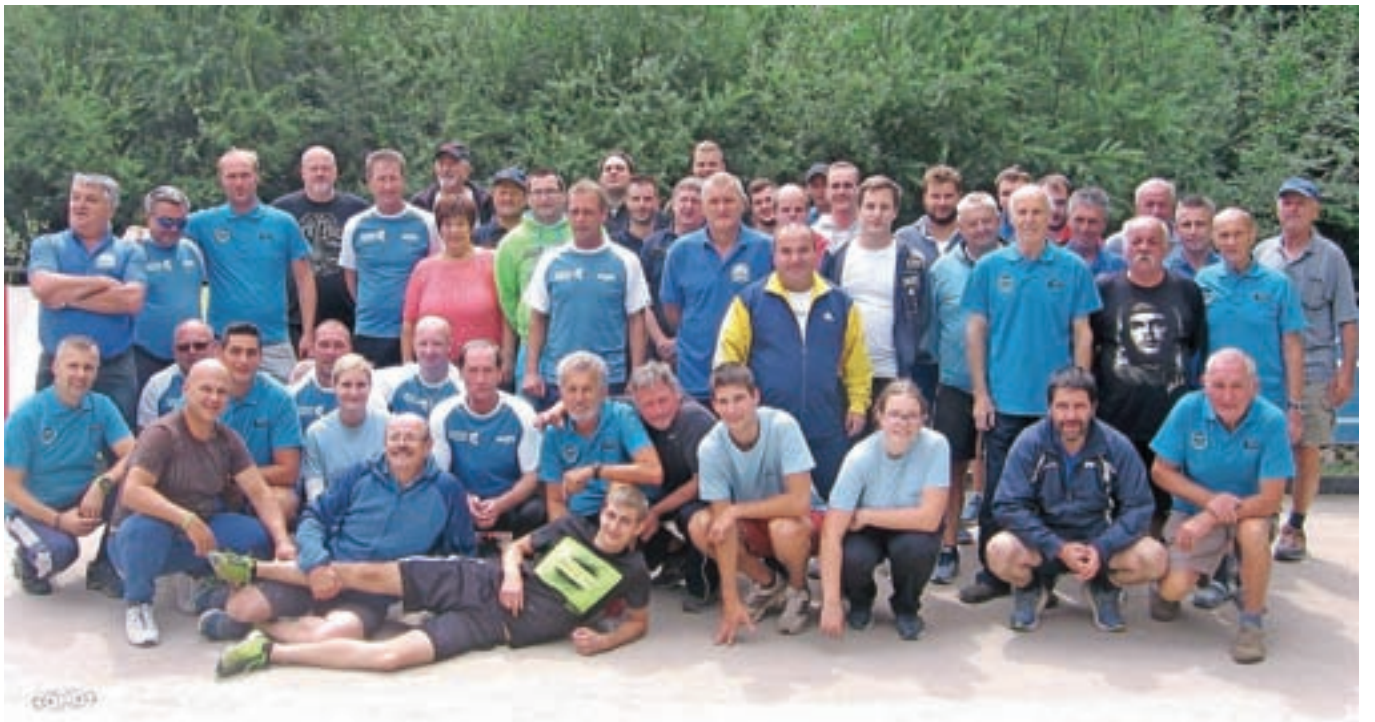
Na jubilejnem turnirju je sodelovalo osem ekip.

Končni vrstni red je bil naslednji: 1. Extreme team, 2. Čatič team, 3. Zavarovalnica Triglav Gold Expres, 4. Društvo upokojencev Podnart, 5. Vipava, 6. Bar Pr' Grmač, 7. Joštov hram, 8. Podbrezje. Vse ekipe so prejele pokale. Največjega sta dobila Bojan in Slavko Jošt, ki sta se udeležila vseh tridesetih turnirjev. Ob druženju organizator največ pozornosti nameni prav tradiciji.