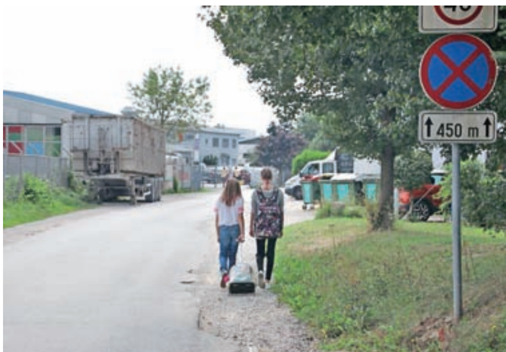
Pred začetkom šolskega leta so pristojni poskrbeli za varne šolske poti; žal situacija na Cesti za Verigo že desetletja ostaja enaka.

Vse zainteresirane prosilce vabimo, da oddajo svojo vlogo v roku 15 dni od objave.